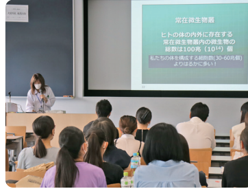
本学歯学部教員による特別講義です