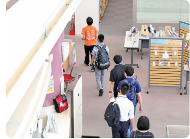
大学生活で使う施設を、学生がご案内します！