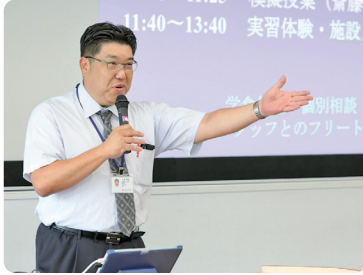
鶴見大学歯学部のご紹介です